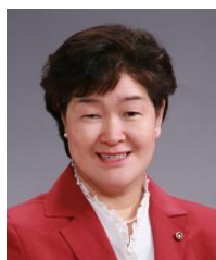
相談事は、お気軽にご連絡下さい

寂しくなってきた庭を彩ってくれる、紫色のノコンギク。可憐な印象です。毎年咲いてくれます。(11/6)